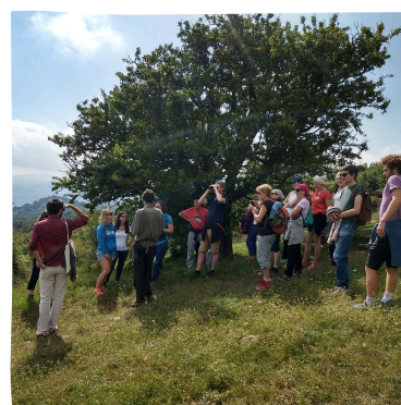
Accueil du public