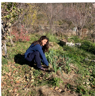
Entretien du jardin