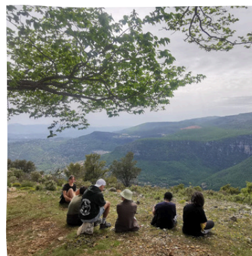
Accueil du public