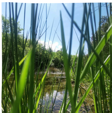
Suivi des mares